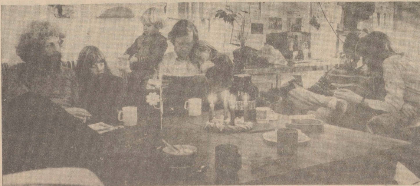
Kollektiv — et alternativ til kjernefamilien?