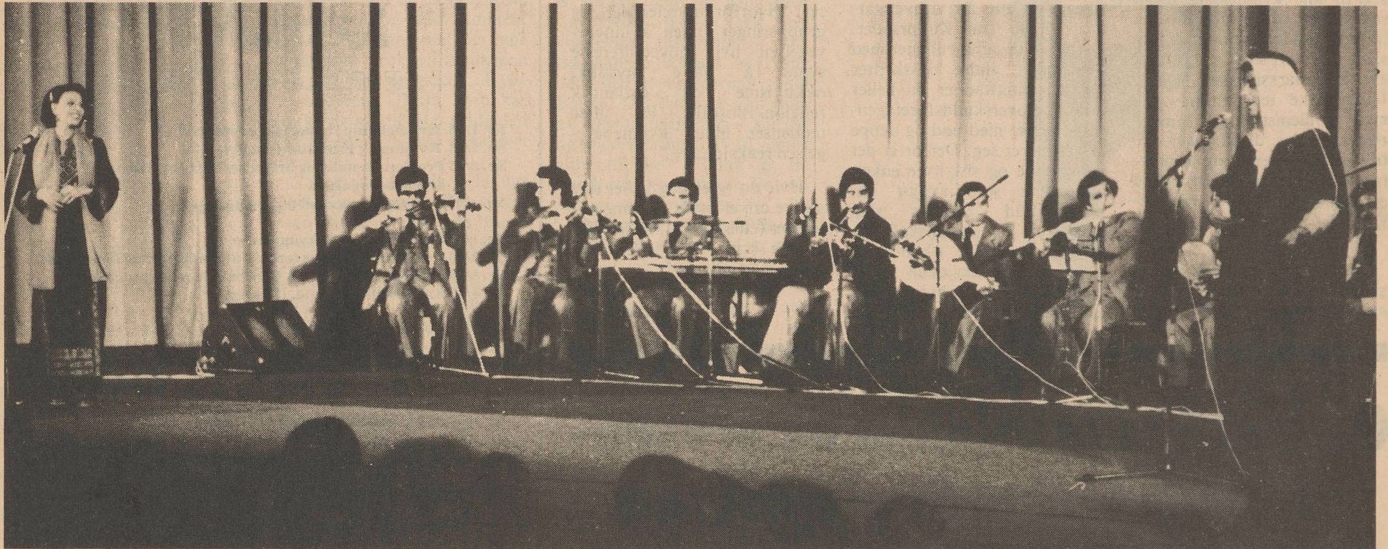
En del av PLO's kulturansamble på totalt 35 personer — dansere, sangere og musikere.

Samarrangement Palestinafronten, Palestina- komiteen og kulturarbeidere i Fokus Kino 31. mars 1979