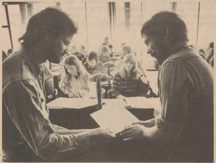
Stemmingsbilled frå Landstinget.

Innimellom arbeidet i kommisjonane var det sesjonar i plenum. Her blei forslaga og endringsforslag til vedtak lagt fram, diskutert og røysta over. Jambørt med kommisjonsarbeidet kom det klart fram kor fastlåst plenumsesjonane var i dei parlamentariske spelereglane. I høve til arbeidet i kommisjonane skjedde det lita eller ingen politisk utvikling. Posisjonane var fastlagte på førehand og det var ikkje lett for folk som ikkje var så