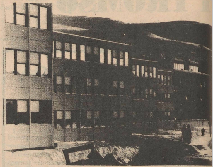
Fra Prestvann Studentheim.

personer på hver gang, og hvor alle må innom for å komme inn på de andre studentboligene, er alle ferske studenter, og det er derfor lettere å få kontakt. Øvre Breivang er den verste plasseren. To deler kjøkken, og det er vanskelig å bli putta sammen med et fremmed menneske. Der man deler kjøkken med flere, er det tross alt innretta